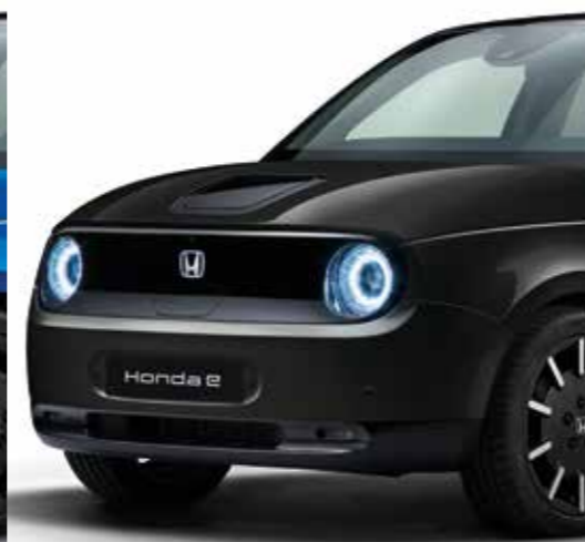
NEGRO CRISTAL PERLADO