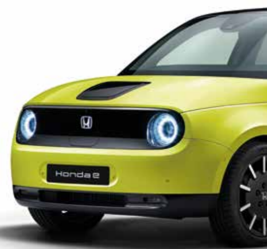
AMARILLO ENERGÉTICO METALIZADO