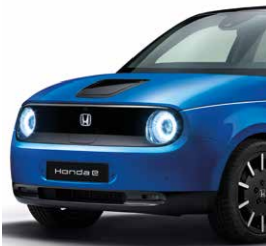
AZUL CRISTAL METALIZADO