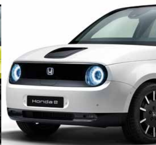
BLANCO PLATINO PERLADO