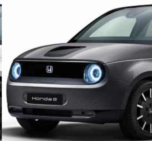
MODERN STEEL METALIZADO